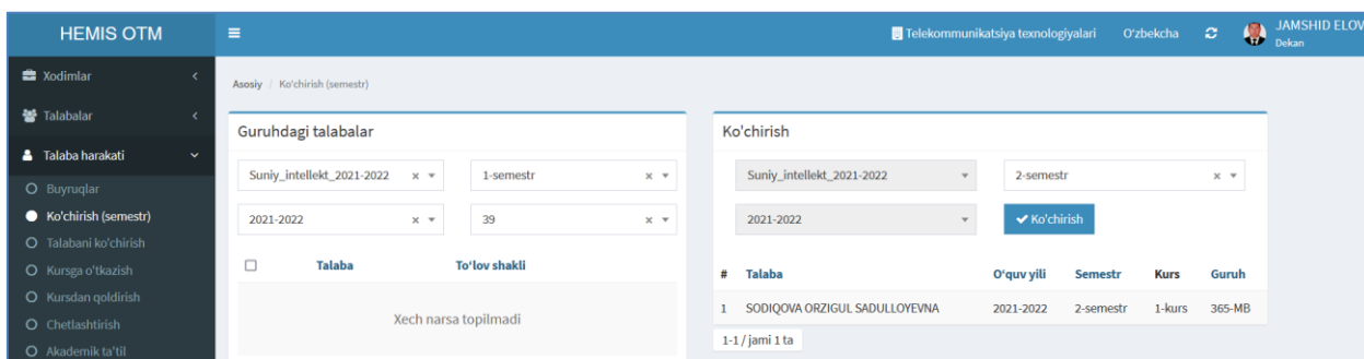
2-расм. Талабани семестрдан семестрга кўчириш

Барча маълумотлар тўғрилигига ишонч ҳосил қилинган Ko'chirish тугмасини танланг. Натижада талаба 1-семестрдан 2-семестрга кўчади ва ойнанинг кўчириш қисмида талабанинг рўйхати пайдо бўлади (2-расм).